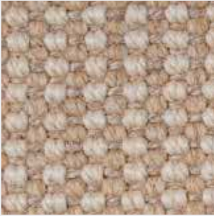
Prunella 64251 natur-beige