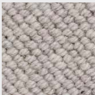
Oase 83500 hellgrau