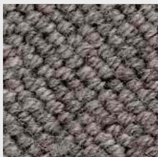
Oase 83501 mittelgrau