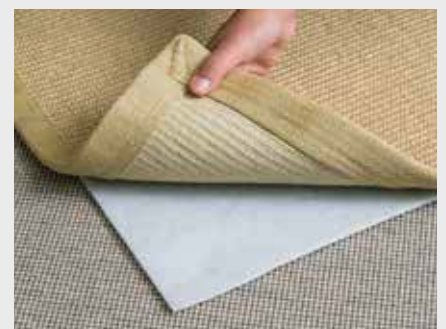
85001 Teppich-Stop auf Teppichböden anti-dérapant pour sols tapissés