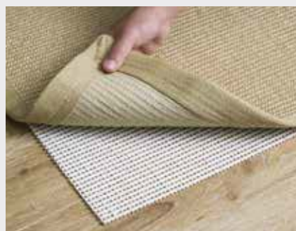
85000 Teppich-Stop auf glatten Böden anti-dérapant pour des sols lisses

Empêche tout risque de glissement sur une surface lisse ou tapissée.