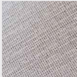
Textil / Action Bac