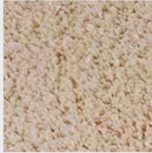
Nuage 83214 hellbeige