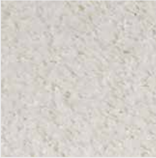
Nuage 83213 weiss