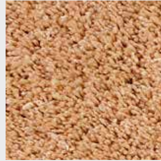
Nuage 83215 beige