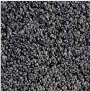
Nuage 83217 dunkelgrau