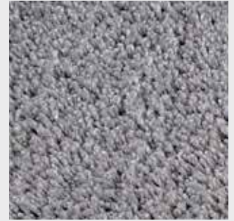
Nuage 83216 hellgrau