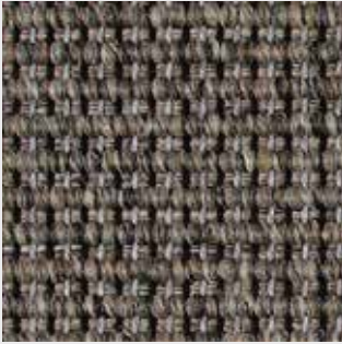
Bagatelle 82149 graubeige